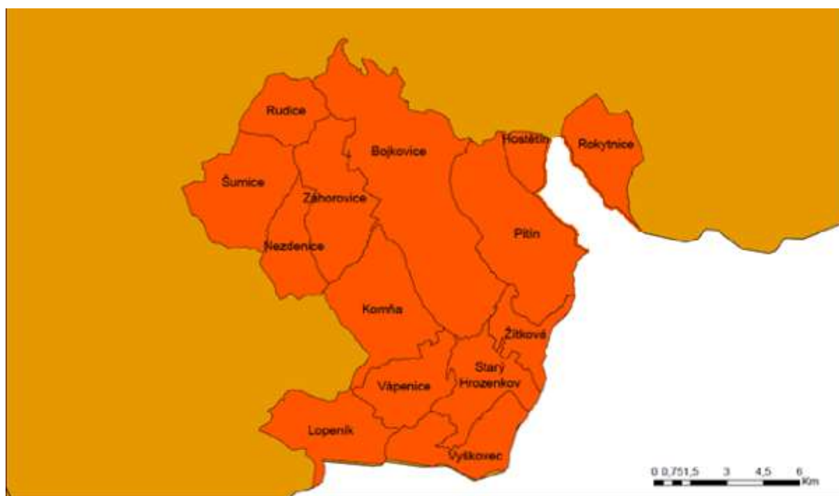
Obrázek 1 Územní působnost MAS Bojkovska, z.s.